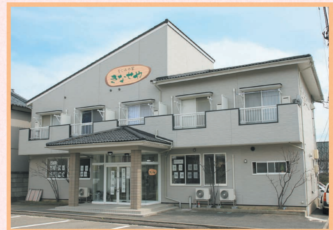
街なかの住宅地にあります。(2階は一般のアパートです。)