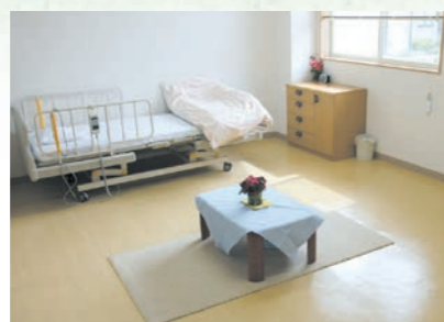
「泊まり」で来られた時の個室、プライバシーが保たれます。