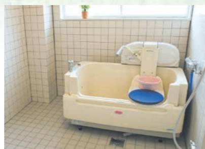
体の不自由な人も楽に入浴できます。