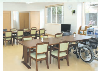
「通い」で来られた時のリビング、楽しい談話がはずみます。