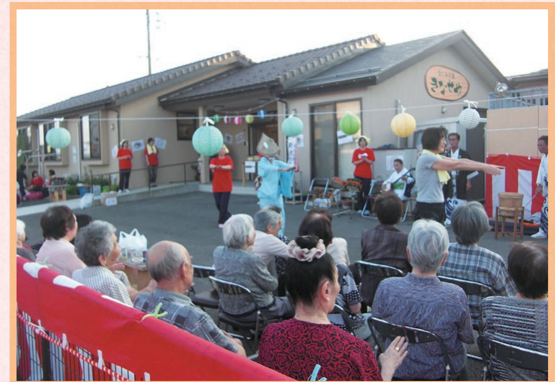
街なかの住宅地にあります。