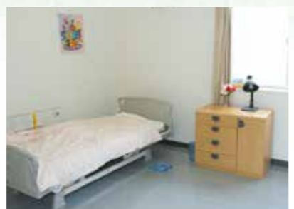
「泊まり」で来られた時の個室、プライバシーが保たれます。