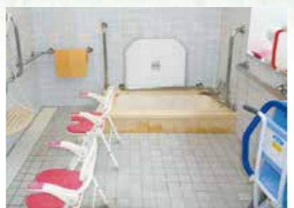
体の不自由な人も楽に入浴できるよう配慮されています。