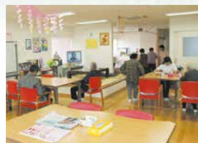
「通い」で来られた時のリビング、楽しい談話がはずみます。