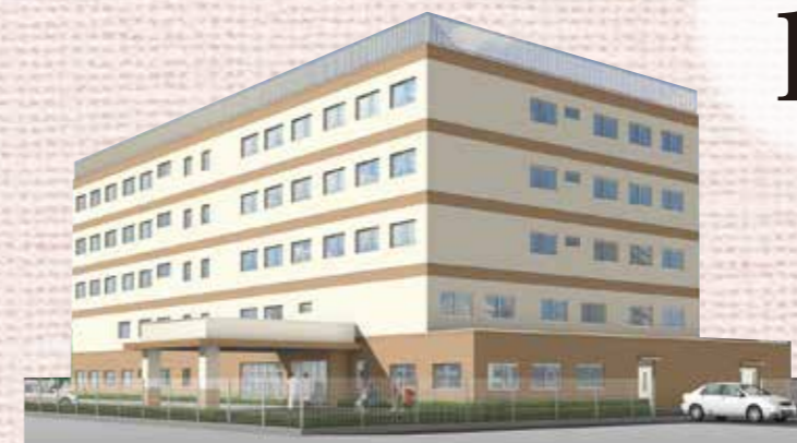
JR関屋駅南口住宅地にあります。