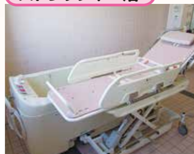
安全安心設計で入浴する方、介助するそれぞれに快適性を追求した浴槽です。