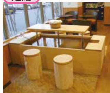
どなたでもお気軽に足湯がご利用頂けます。