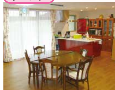
「通い」で来られた時のリビング、楽しい談話がはずみます。