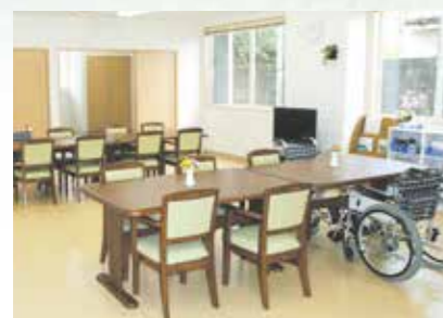
「通い」で来られた時のリビング、楽しい談話がはずみます。