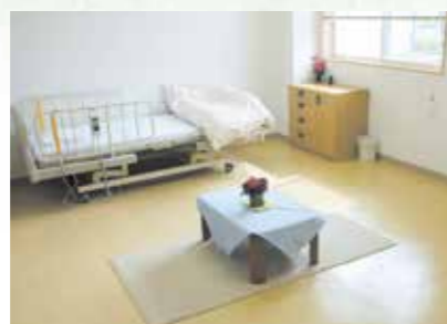
「泊まり」で来られた時の個室、プライバシーが保たれます。