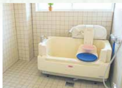
体の不自由な人も楽に入浴できます。