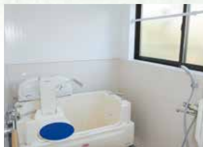
体の不自由な人も楽に入浴できます。