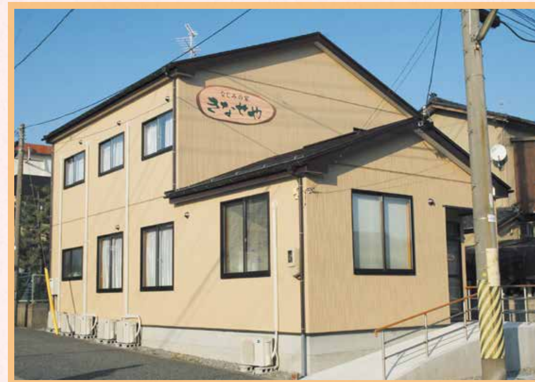
街なかの住宅地にあります。