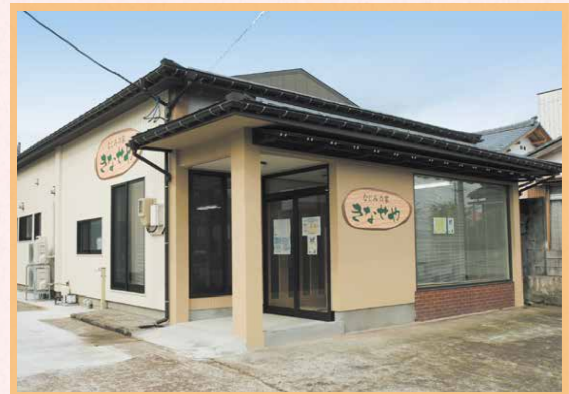
街なかの住宅地にあります。