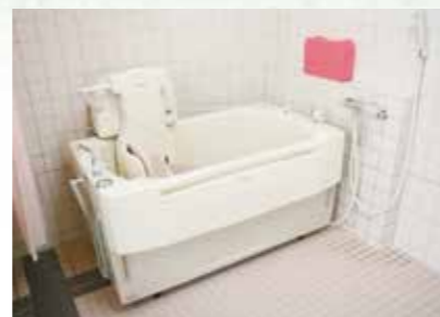
体の不自由な人も楽に入浴できます。