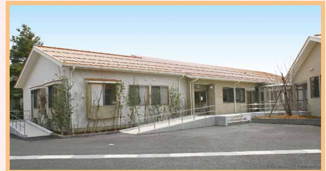
街なかの住宅地にあります。