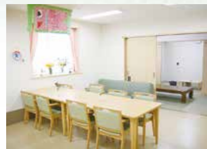
「通い」で来られた時のリビング、楽しい談話がはずみます。