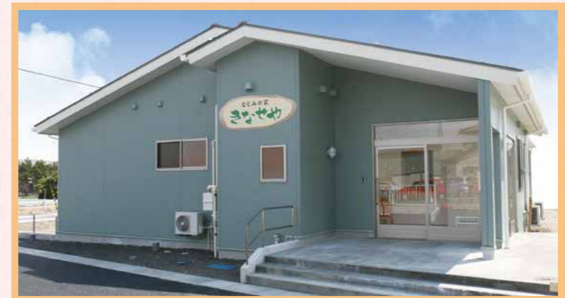
街なかの住宅地にあります。