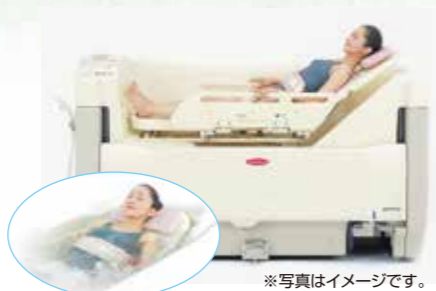
※写真はイメージです。 100%新湯方式で清潔、爽快に入浴できます。大型サイドフェンスで安全・安心です。肌触りの良い熱圧成型マットで快適です。