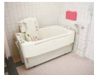
一般浴室(3~4人入れます)。