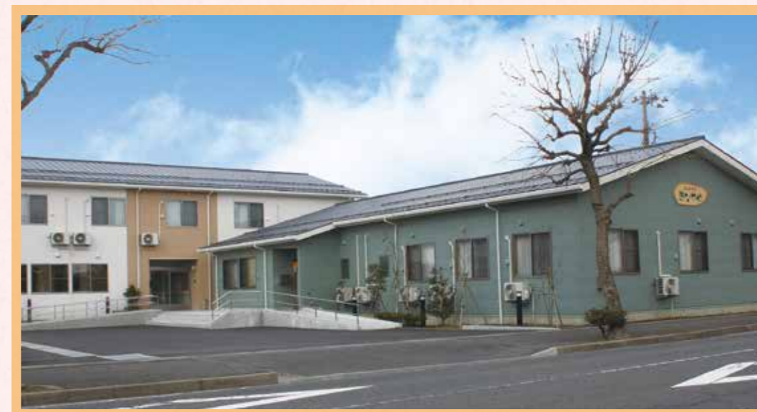
街なかの住宅地にあります。