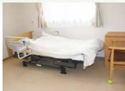
手元スイッチで、背や膝の角度とベッドの高さが自由に操作できます。運転音の静かな3モーター式介護ベッド。