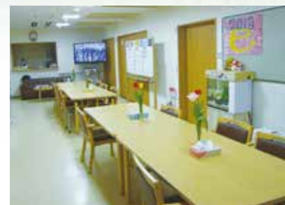
「通い」で来られた時のリビング、楽しい談話がはずみます。