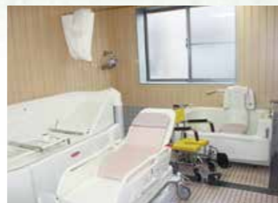
体の不自由な人も楽に入浴できます。