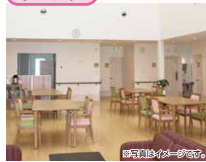
「通い」で来られた時のリビング、楽しい談話がはずみます。