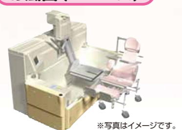
最新式のゆとりサイズで、ご利用者様の負担を軽減。座面の位置を「左右選択」で入浴可能とし、入浴しやすくなりました。介護度1~5の全ての皆様にご利用頂けます。