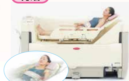
100%新湯方式で清潔、爽快に入浴できます。大型サイドフェンスで安全・安心です。肌触りの良い熱圧成型マットで快適です。