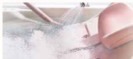
浴槽内もゆったりで、しっかり入浴が可能な入浴機器を備えています。入浴者の頭からつま先まで、全身のケアがしっかりおこなえます。