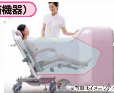
肩掛けシャワーは入浴中だけでなく排水中でも使用できるので、湯冷めを防ぐことができます。また、半身浴も可能です。ジェット噴流を2基搭載。快適な入浴が楽しめます。