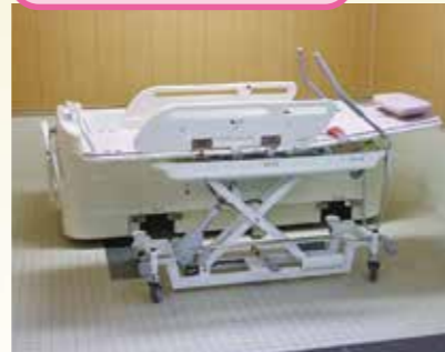
安全安心設計で入浴する方、介助するそれぞれに快適性を追求した浴槽です。