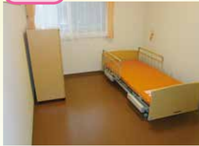
落ち着いた雰囲気なお部屋で、各部屋にナースコールを設置しておりますので、安心してプライベート空間で過ごせます。