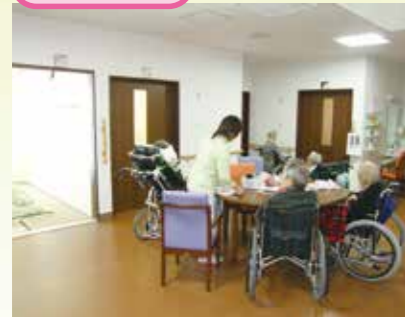
「通い」で来られた時のリビング、楽しい談話がはずみます。