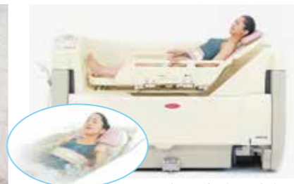
100%新湯方式で清潔、爽快に入浴できます。大型サイドフェンスで安全・安心です。肌触りの良い熱圧成型マットで快適です。