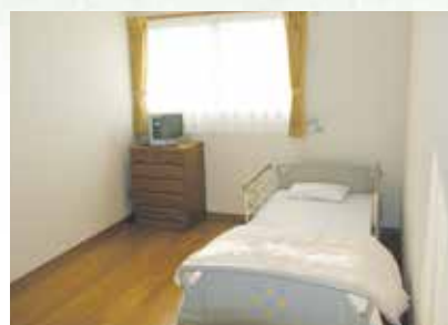
「泊まり」で来られた時の個室、プライバシーが保たれます。