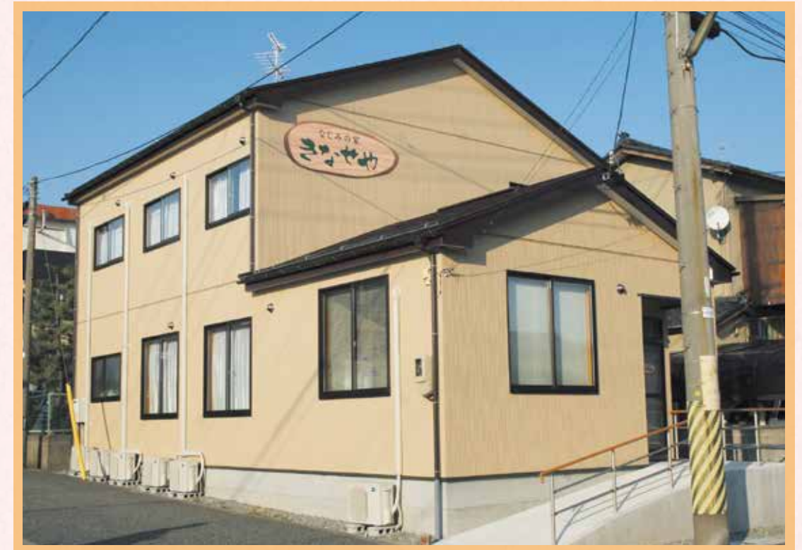
街なかの住宅地にあります。