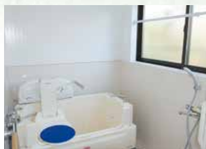
体の不自由な人も楽に入浴できます。