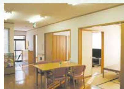
「通い」で来られた時のリビング、楽しい談話はずみです。