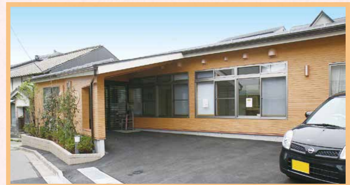
街なかの住宅地にあります。