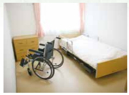
「泊まり」で来られた時の個室、プライバシーが保たれます。