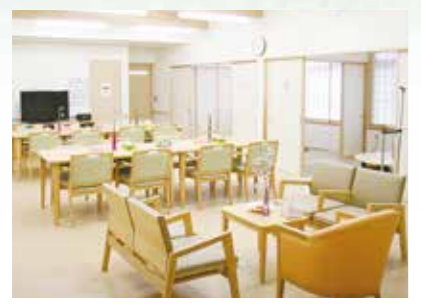
「通い」で来られた時のリビング、楽しい談話がはずみます。