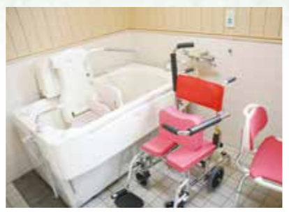
体の不自由な人も楽に入浴できます。