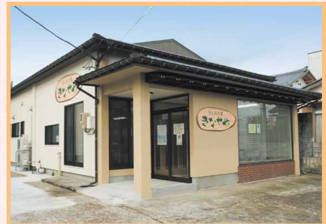
街なかの住宅地にあります。