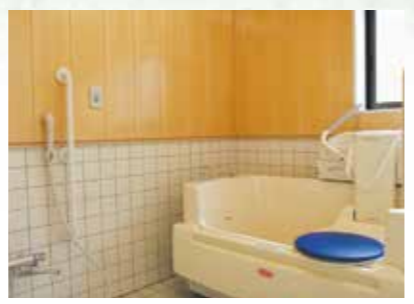
体の不自由な人も楽に入浴できます。