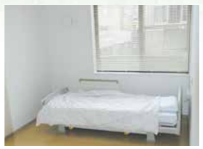
「泊まり」で来られた時の個室、プライバシーが保たれます。