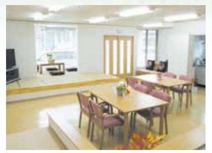
「通い」で来られた時のリビング、楽しい談話はずみずみです。