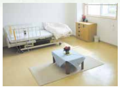
「泊まり」で来られた時の個室、プライバシーが保たれます。