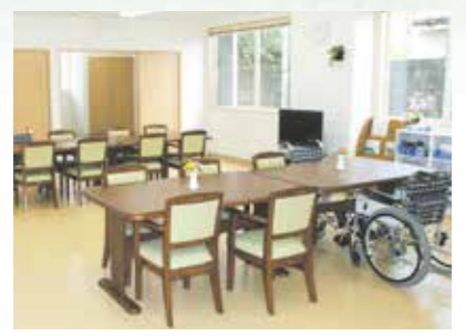
「通い」で来られた時のリビング、楽しい談話がはずみます。