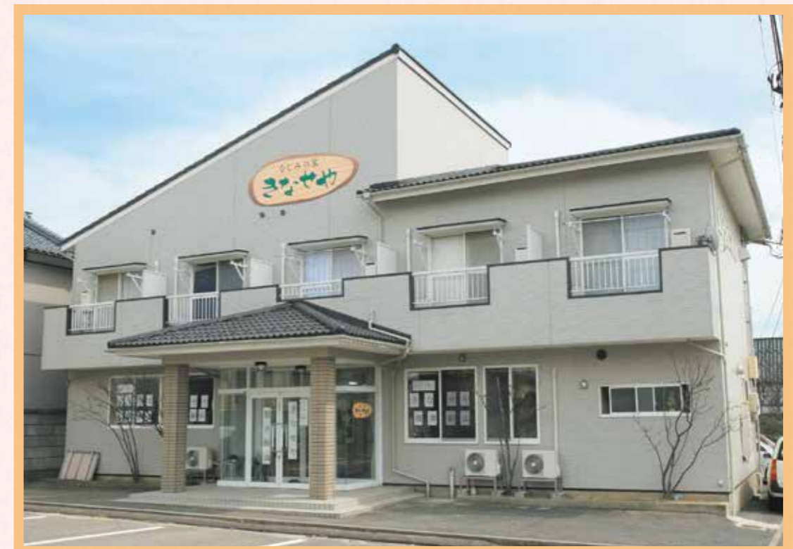
街なかの住宅地にあります。(2階は一般のアパートです。)