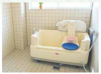
体の不自由な人も楽に入浴できます。