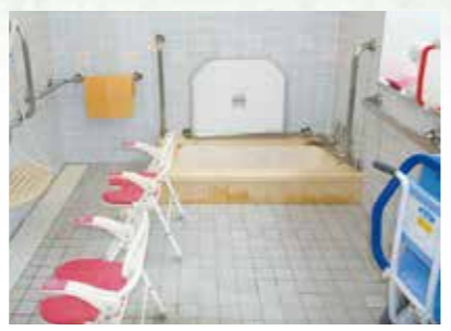
体の不自由な人も楽に入浴できるよう配慮されています。