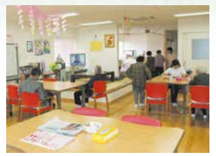
「通い」で来られた時のリビング、楽しい談話がはずみます。