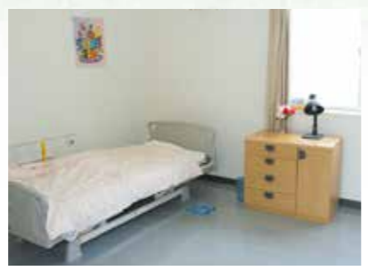
「泊まり」で来られた時の個室、プライバシーが保たれます。