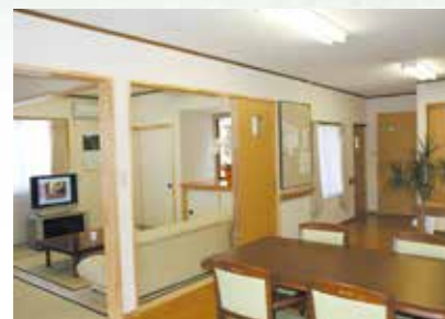
「通い」で来られた時のリビング、楽しい談話がはずみます。