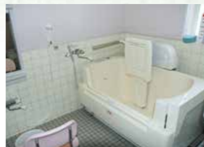
体の不自由な人も楽に入浴できます。