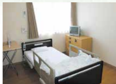
「泊まり」で来られた時の個室、プライバシーが保たれます。