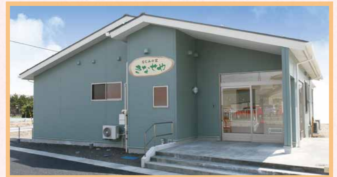
街なかの住宅地にあります。