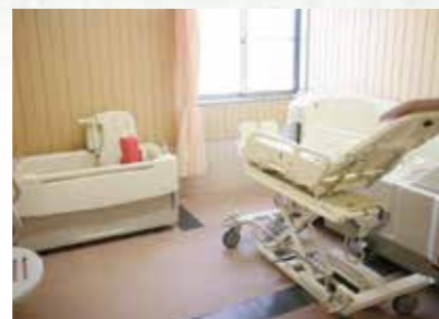
体の不自由な人も楽に入浴できます。