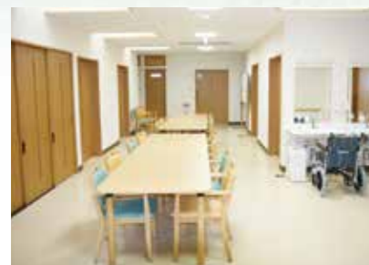
「通い」で来られた時のリビング、楽しい談話がはずみます。