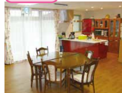
「通い」でいられた時のリビング、楽しい談話がはずみます。