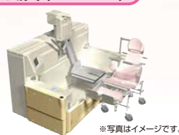
※写真はイメージです。 最新式のゆとりサイズで、ご利用者様の負担を軽減。座面の位置を「左右選択」で入浴可能とし、入浴しやすくなりました。介護度1~5の全ての皆様にご利用頂けます。