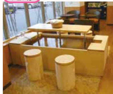
どなたでもお気軽に足湯がご利用頂けます。