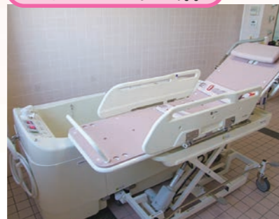
安全安心設計で入浴する方、介助するそれぞれに快適性を追求した浴槽です。