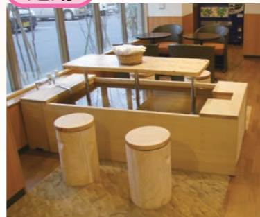
どなたでもお気軽に足湯がご利用頂けます。