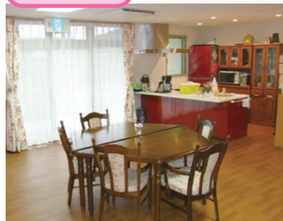
「通い」で来られた時のリビング、楽しい談話がはずみます。