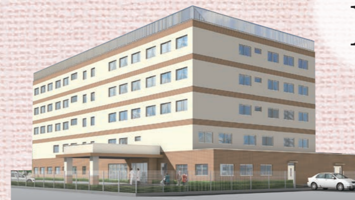
JR関屋駅南口住宅地にあります。