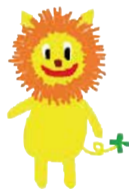
イメージキャラクター せきおくん