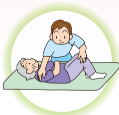
在宅での リハビリテーション