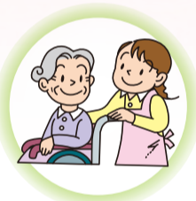
認知症や 心理的なケア