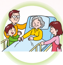
在宅生活を支える 指導・助言